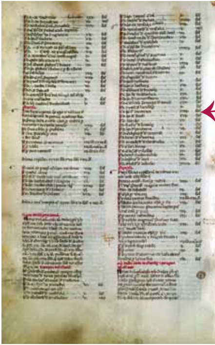
Abb. 2: Matrikeleintrag Johanns von Buch, Bologna 1305. Archivio storico dell' Università di Bologna, Archivio della Natio germanica, Annales liber primus (1311–1595), fol. 30v.