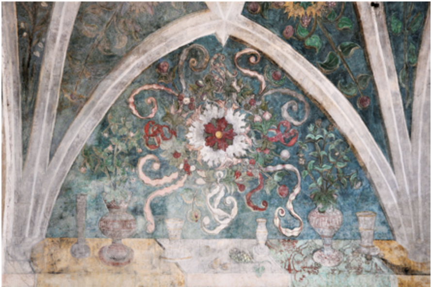
Abb. 4: Illusionistische Wandmalerei der »Schatzkammer«. mit freundlicher Unterstützung des Hotels Frenzelhof, Untermarkt 5 in Görlitz.